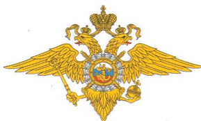
ОМВД России по г. Феодосии